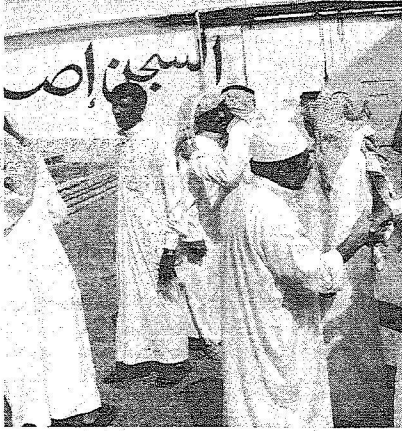
يعانقون اقاربهم خارج السجن