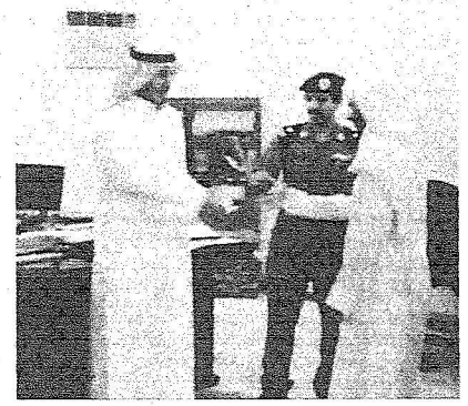
مدير سجون الباحة يقدم هدية تذكارية لأحد المعفو عنهم