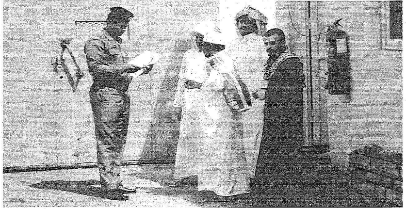
امام بوزارة السجن يوم امس