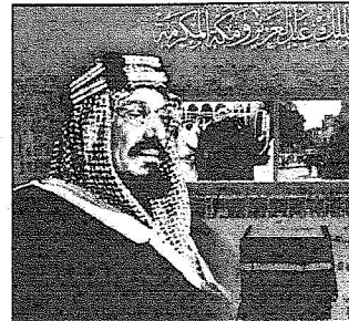
الملك عبدالعزيز ومكة المكرمة