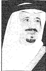
الأمير سلمان بن عبدالعزيز

وقد عبر معالي مدير جامعة أم القرى الدكتور عدنان بن محمد وزان، عن فخره واعتزازه بزيارة سموه الكريم للجامعة وحديثه العاطف عن