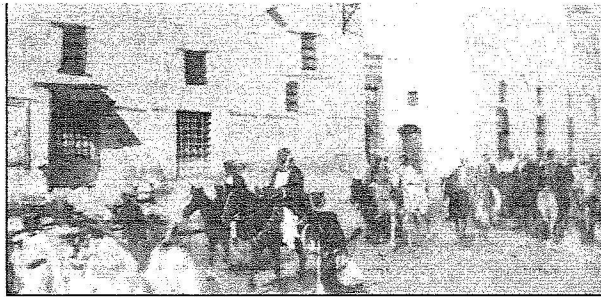
لقطة من أوائل الصور لجلالة الملك عبدالعزيز في مكة المكرمة