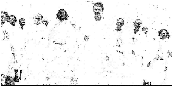
الملك عبدالعزيز بلباس الإحرام وإلى يمينه الأمير سعود بن عبدالعزيز عام 1٩٣٥م