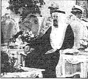
الأمير عبدالرحمن خلال حفل تخران