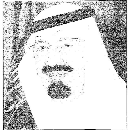
خادم الحرمين الشريفين

وسيدأ الحفل الشعبي بالقرآن الكريم ثم كلمة أهالي المنطقة، بعدها تقدم بعض القصائد الشعرية ثم تبدأ العروض الشعبية بلون (الزامل) المعروف عند أهالي نجران والذي يشمل أيضاً فقرة (الرزقة). ثم يقدم أهالي محافظة شرورة لون (الشرح). كما يقدم أهالي المحافظات الشمالية حيوناً وثاراً وديمة ويدر الجنوب الفقرة الشعبية الخاصة بهم، بعدها يقدم نخبة من أهالي المنطقة اللون الشعبي المعروف