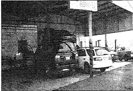
مهندس يجري فحصاً تقنياً لعدد من السيارات