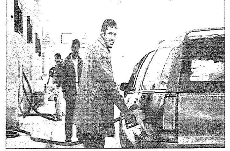
سيارة تتزود بالوقود في إحدى المحطات أمس