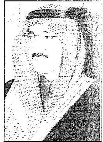
الأمير محمد بن نايف

والد يوسف الربيش: أشكر خادم الحرمين وولي عهده وسمو وزير الداخلية