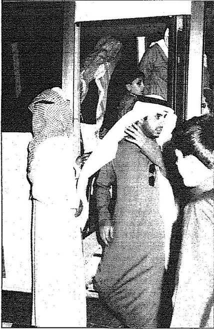
أهالي العائدين لدى عودتهم من الزيارة