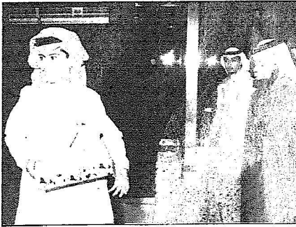
وزارة الداخلية وبعث تهديفا على أسر المعتدين