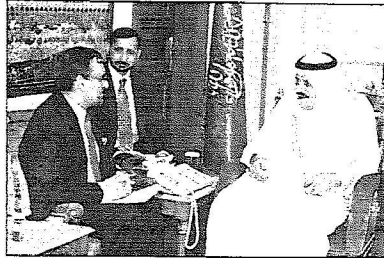
سمو النائب الثاني يستقبل الوزير الباكستاني