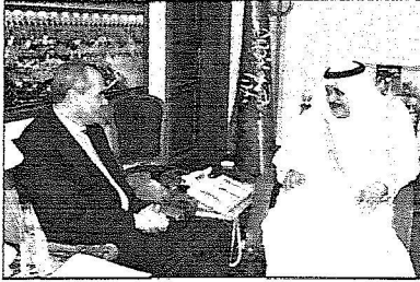
و يستقبل السفير المصري