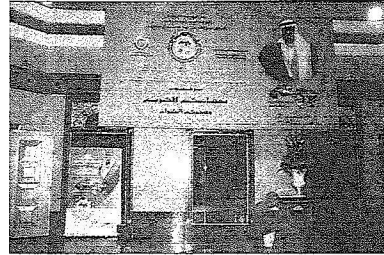
لائحة المؤتمر على واحده الفندق

وأكد وكيل الوزارة للثروة المعديّة انه بتوجيه من رئيس المؤتمر وزير البترول