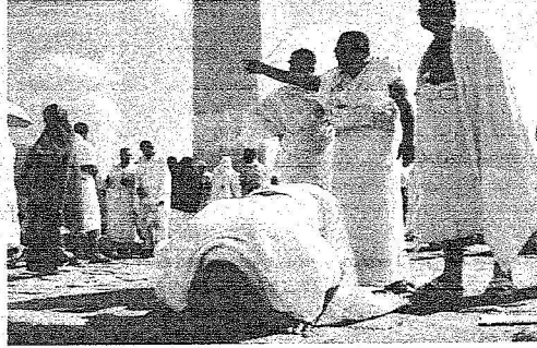
حاج يؤدي الصلاة بجوار الشاخص في جبل الرحمة بعرفات