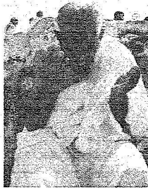
حاج يدعو بعرفات في خشوع

الاستعدادات لخدمة ضيوف الرحمن وضعت الأجهزة الأمنية خططاً محكمة من بينها خطط مرورية لضمان وصول الحجاج إلى مخيماتهم قبل غروب شمس اليوم الاثني عشر، كما أعدت خطة مرورية لتأمين النفرة، وكذلك خططاً دقيقة لمراقبة تحركات