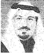
فيصل بن مشعل

اعلن صاحب السمو الملكي الأمير الدكتور فيصل بن مشعل بن سعود بن عبدالعزيز نائب أمير منطقة القصيم ترسية انشاء سوق عالي جديد للتمور في بريدة بتكلفة 52 مليون ريال مشيراً الى أهمية دور السوق في دعم الأسر المنتجة حيث يوجد أكثر من 40