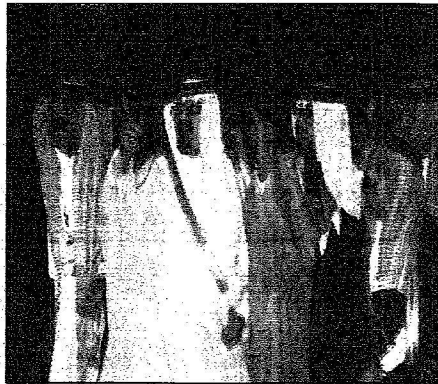
خادم الحرمين يشاهد مركز الملك عبدالعزيز الحضاري بحقل