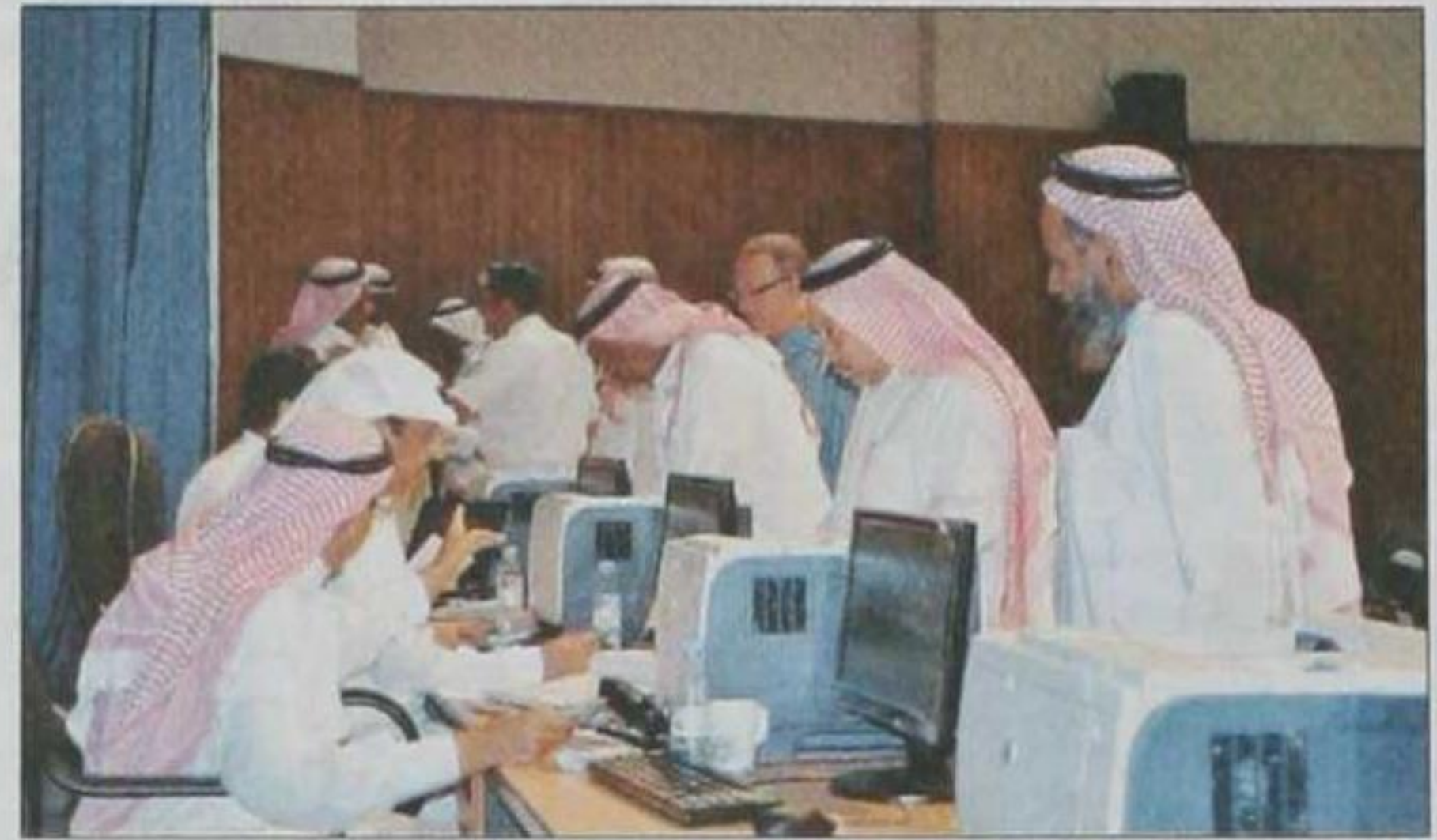
لجان الصرف خلال تدقيقها في الأوراق