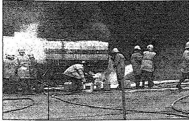
لقطة من الحادث