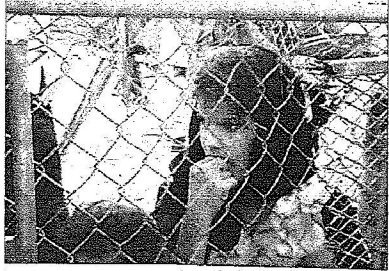
هكذا هم الفقراء