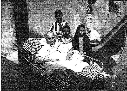
المجالبي مع ابنائه