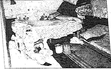
امراة مسنة في بيت متهاالك