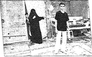
هذا هو منزلي