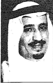
سلطان بن عبدالعزيز