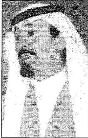
عبدالله بن عبدالعزيز