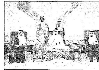
لقطات من حفل تدشين جامعة الأميرة نورة