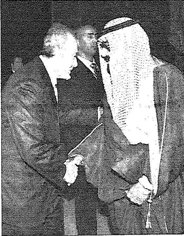
المليك مصافحاً الأمير سعود الفيصل

والإعلام الأستاذ إياد بن أمين مدني والشيخ مشعل عبدالله الرشيد ومعالي مستشار خادم الحرمين الشريفين الأستاذ عبدالمحسن بن عبدالعزيز التويجري ومعالي رئيس الديوان الملكي الأستاذ خالد بن عبدالعزيز التويجري ومعالي رئيس المراسم الملكية الأستاذ محمد بن عبدالرحمن الطيبشي ومعالي رئيس الشؤون الخاصة لخادم الحرمين الشريفين الأستاذ عادل بن أحمد الجبير.