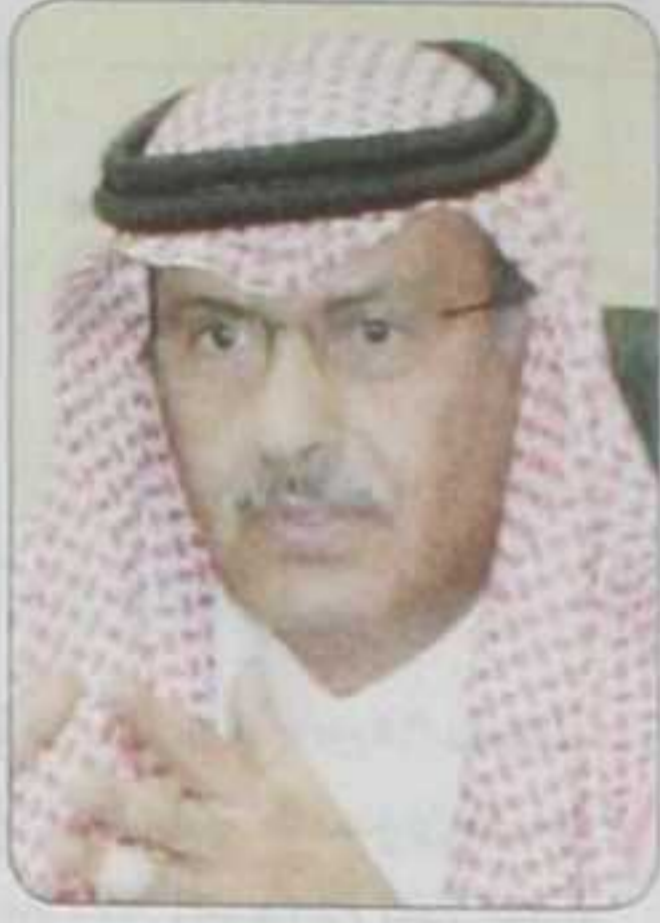
الدكتور فهد بالغنيم

توجهات خادم الحرمين الشريفين وسمو ولي عهده الأمين وسمو النائب الثاني وحكومة وشعب المملكة . وأضاف وزير الزراعة بأن الأعمال جارية على قدم وساق لتنفيذ كافة المشروعات التنموية الطموحة، وطرح الأفكار والرؤى المستقبلية التي من شأنها تنفيذ متطلعات الجميع.