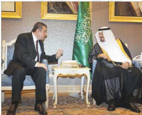
الأمير سلطان بن عبد العزيز خلال استقباله وزير الخارجية المصري (أيس)