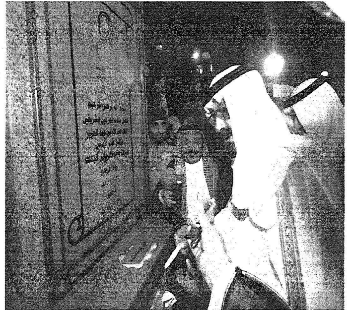
الملك عبد الله يضع حجر الأساس لمدينة الأميرة نورة بنت عبد الرحمن الجامعية.