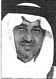
الأمير خالد الفيصل