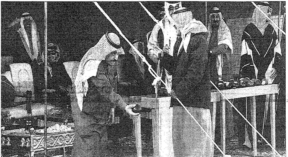
..والأمير نايف بن عبدالعزيز كذلك، (واس)