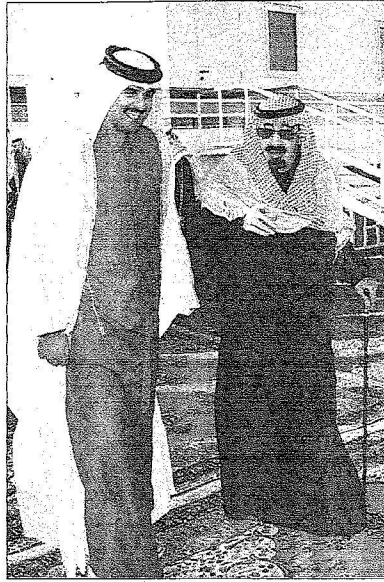
الملك مرحبا بولي عهد قطر في روضة خريم أمس. (واس)