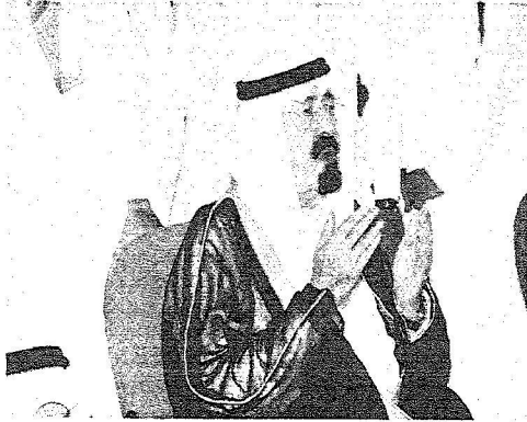
..ويؤدي ركعتي الطواف..