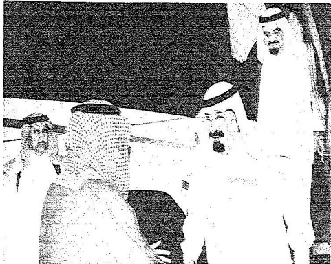
خادم الحرمين الشريفين لدى وصوله جدة.