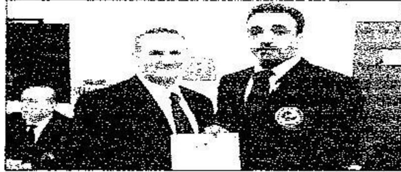
الحكم العالمي عبدالرحمن المحارب يتسلم