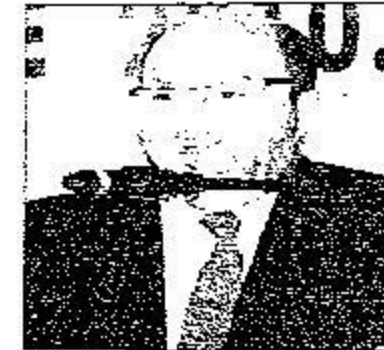
رئيس الاتحاد الدولي أنتوني أسينوس