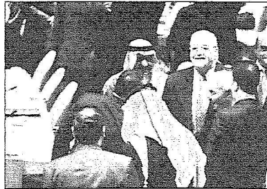
الأمير مقرن بن عبدالعزيز في حوار مع بعض الوفود