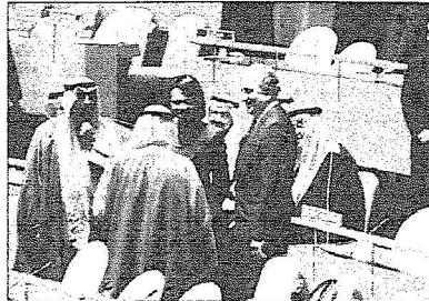
وزيرة الخارجية الأمريكية تلتقي الوفد السعودي على هامش الاجتماع