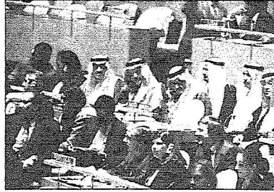
الوفد السعودي يتابع أعمال الجلسة الافتتاحية لحوار الأديان