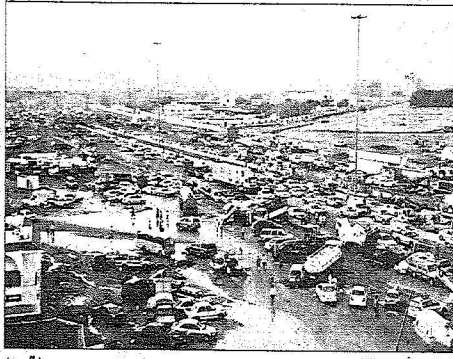
كارتة جده اكبر من الكلام (اليوم)

وأوضح أمير منطقة مكة المكرمة إن هذا القرار اشتمل على الحاصية واشتمل على التطوير والبناء وإعادة تخطيط شرق مدينة جدة وتروجو أن تتمكن جميعا من أن تكون على مستوى أمال ومطامح خادم الحرمين الشريفين وإن يتم تخطيط وتنفيذ مخطط شرق جدة على المستوى الذي يتوخاه صاحب الأرض في هذه البلاد. ومن تقديم المنعمين في كارتة سيول جده كان واضحا وجليا. ومن وجود اسماء جديدة معتمه في قاطعة سيول جده أكد أنه ليس هناك أي اسماء جديدة وإنما الواردة في التقرير فقط.