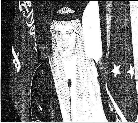
الأمير سعود الفيصل خلال المؤتمر الصحافي، واس.

دوست بلازيه: تحليلاتنا حول أزمة الشرق الأوسط متقاربة ومتشابهة