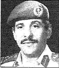
الواء فهد الحميدي