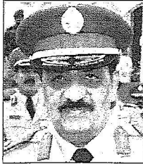
الواء الركن أحمد الريمان