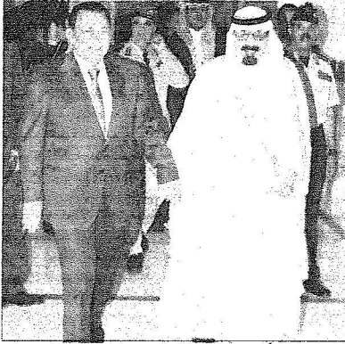
الملك مصاحباً لإخاه الرئيس حسني مبارك

خادم الحرمين به وبمراقبته في الحملة. كما كان في استقبال فخامته في مطار الملك عبدالعزيز الدولي صاحب السمو الملكي الأمير خالد الفيصل بن عبدالعزيز أمير منطقة مكة المكرمة، ومعالي أمين محافظة جدة المهندس عادل فقيه، ومعالي رئيس المراسم الملكية الأستاذ محمد بن عبدالرحمن الطيبشي، وسفير مصر لدى المملكة محمد عبدالحميد قاسم.