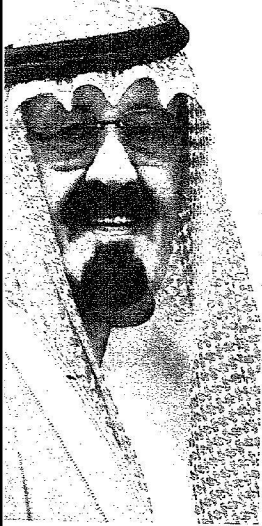
الملك عبد الله