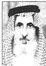
الشيخ سعاد الجروني