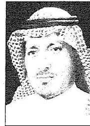
عبد الله بن عمر