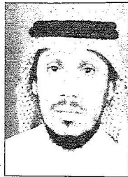
الشريف بن الأمير