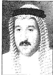
مدي أي حموري