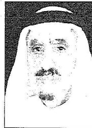
عبدالله بن فهد بن مبارك