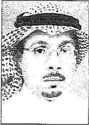
ناصر بن مبارك