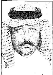
الشيخ محمد الخawas