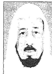
الشيخ محمد أي جروني