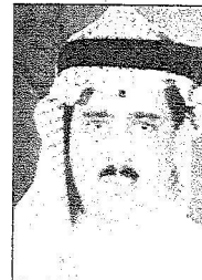
فهد بن علي بن طلال