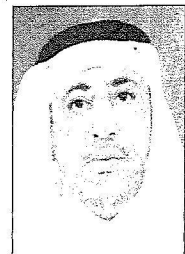
الشيخ محمد بن تميم