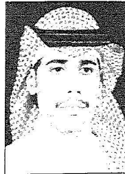
حسن بن زيد