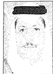
محمد بن تميم