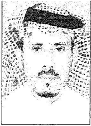
جابر بن سعود