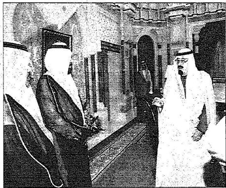
الملك متحدثاً إلى السفراء بعد أدائهم القسم بين يديه في الرياض أمس.