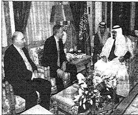
..ومستقبلاً طويبي بلير في الرياض أمس.