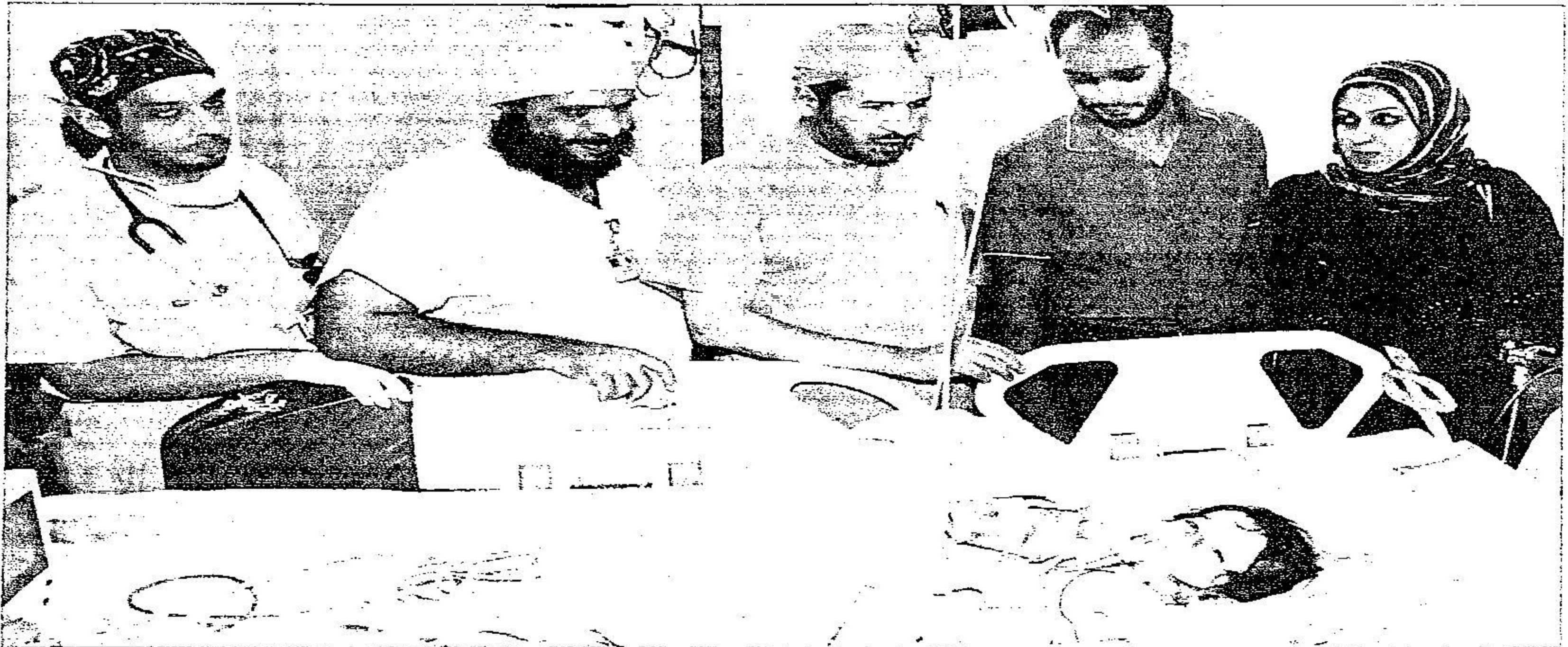
الربيعة والدهن والزغبى مع الطفلة ووالدتها بعد العملية

11 طبيباً سعودياً أجروا الجراحة وتناولوا الإفطار داخل غرفة العمليات