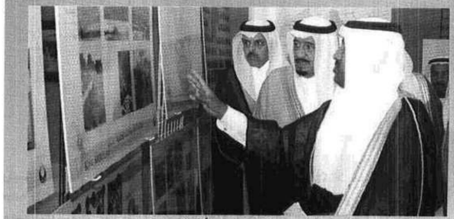
الأمير سلمان يشاهد صوراً للمشروعين

بمساحة (٢٤١,٧٠٠,٠٠٠) وبلغت التبرعات التي قدمها أهالي الرياض لهذا المشروع الضخم (١١٠,٠٠٠,٠٠٠) ريال. وسيتم تنفيذه في الموقع الذي قدمته أمانة منطقة الرياض على طريق جدة السريع حيث سيشتغل المشروع على أنماط للحدائق العالمية، ويضم ركن «الحديقة الدولية»، الحديقة الأمريكية والحديقة الأوروبية والحديقة الأسترالية والآسيوية، والأفريقية، فيما تضم «الحديقة النباتية»، متحف النباتات والبيئات المحمية والنباتية وبنك البذور والحديقة الصخرية والحديقة الصحراوية، ويحوي ركن «الحدائق المائية، حديقة الثلج وحديقة الماء وحديقة الأسماك وحديقة الشلالات، وتحتوي حدائق الطفل، على حدائق الاكتشاف وحدائق الهدايا ومسرح مكشوف ومطاعم ومقاهي كما يضم «حديقة معلقة، ذات مصابيح نجدية وساحة للعروض وجلسات ومناطق استراحة وخدمات متنوعة، وتحوي الحدائق العلمية كذلك حديقة الزهور والحديقة الفيزيائية والحديقة الجيولوجية وحديقة الطيور وحديقة الفراشات وحديقة الزواحف. فيما سيقام مشروع «متنزه الملك عبدالله بالمرز، في موقع نادي الفروسية سابقاً ويغطي مساحة (٣٢٠,٠٠٠)م ٢ وقد تم الانتهاء من إعداد الدراسات والتصاميم الأولوية وسيتم طرحه للتنفيذ حيث رصد في ميزانية أمانة منطقة الرياض مبلغ (٧٧,٠٠٠,٠٠٠) ريال لصالح هذا المشروع، ويضم هذا المشروع نادياً للفروسية وملاعب أطفال وحدائق ومحلات تجارية وواحة للعلوم ومركز معارض ومنطقة لإطلاق البالون «المنطاد، وخدمات متكاملة وساحة للعروض وحديقة مائية وممرات للمشاه ومناطق للشباب وجلسات عائلية وعدداً من الخدمات والتجهيزات الأخرى.