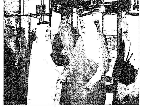
سموه لدى وصوله البنى

واجبنا في المنطقة تذليل العقبات أمام رجال الأعمال والوطنيين