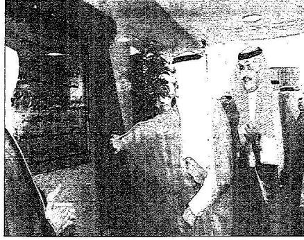
الأمير محمد يزيح الستارة لافتتاح البنى