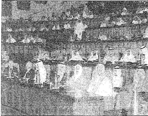
جانب من حضور المسؤولين لجلسات الورشة