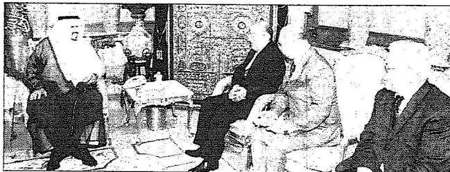
ولي العهد خلال استقباله في الرياض أمس الأول وزير شؤون الطوارئ في جمهورية أذربيجان الفريق أول كمال الدين حيدروف.