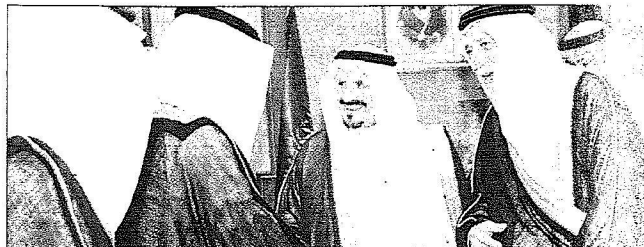
الأمير سلطان بن عبد العزيز مستقبلاً عبد المقصود خوجة وعددًا من أفراد أسرته أمس الأول في الرياض.