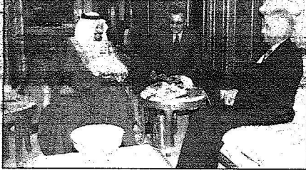
سمو ولي العهد يستقبل السفير التركي ، وياس