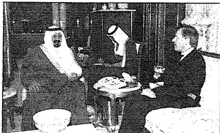
سموه مستقبلاً سفير المملكة المتحدة - بو.أس.