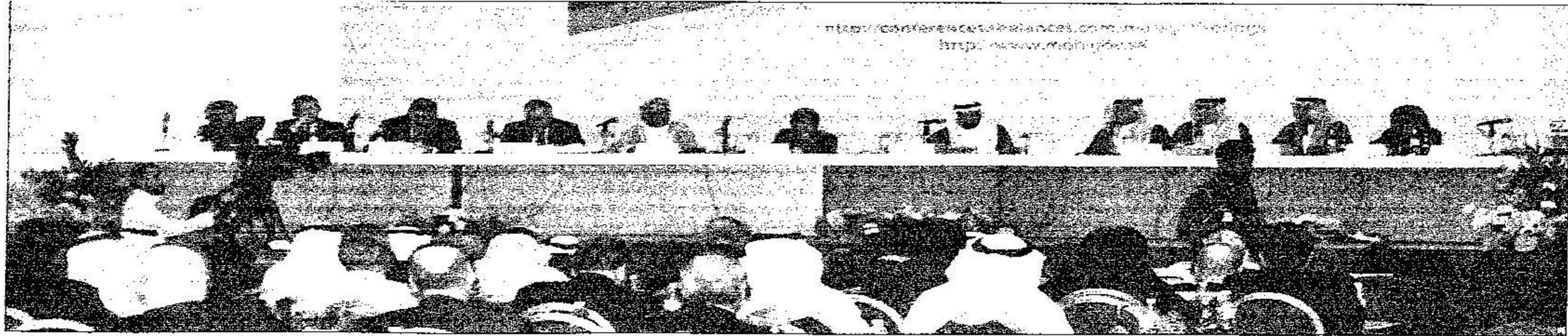
الطابولة المستديرة التي جمعت وزير الصحة د.عبد الله الربيعة ود.عبد العزيز خوجة ود.فؤاد الغارسي ووزراء الصحة الخليجين ضمن مؤتمر طب الحشود أمس.