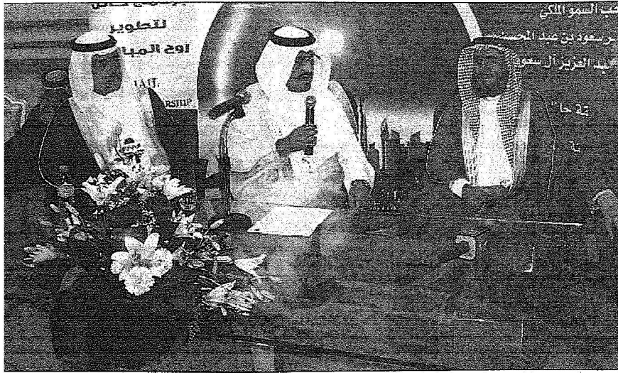
يؤممه يلقى كلمته خلال حفل التوقيع