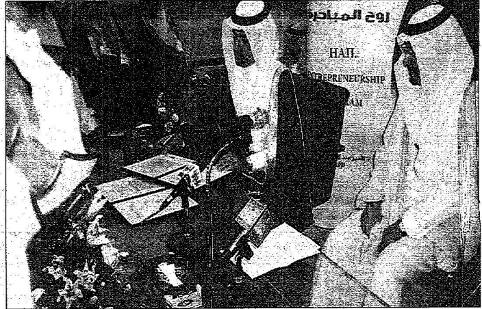
التوقيع على الاتفاقية الثانية