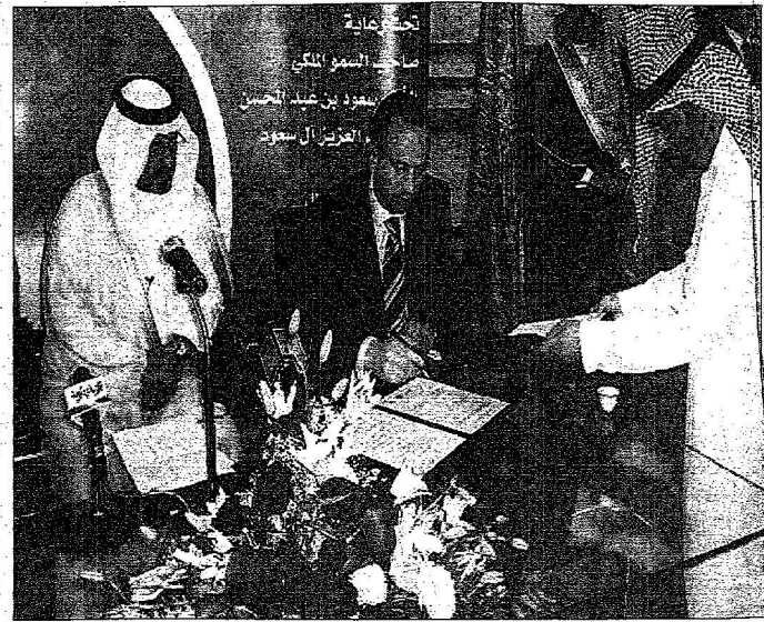
هطل توقيع الاتفاقيات