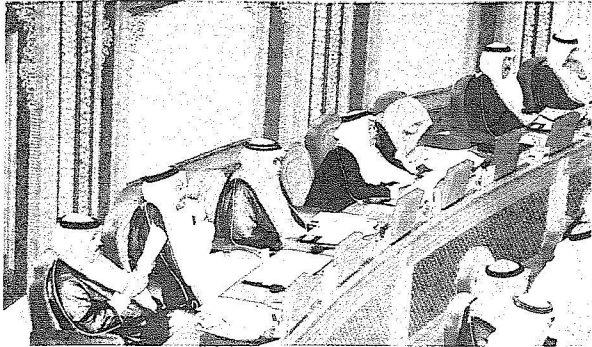
جانب من جلسة الشورى امس

نوم رئيس مجلس الشورى الدكتور صالح بن عبد الله بن حميد خلال جلسة المجلس العادية الاولى من السنة الثانية من الدورة الرابعة التى عقدها المجلس امس بحفل افتتاح أعمال السنة الثانية من الدورة الرابعة للمجلس الذى رعاه خادم الحرمين الشريفين الملك عبد الله بن عبدالعزيز حفظه الله اول امس.