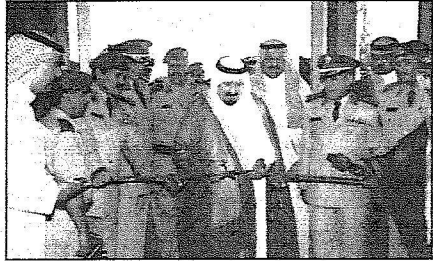
ولي العهد يشن أحد المشاريع الطبية العسكرية