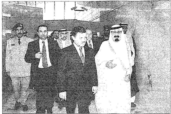
خادم الحرمين الشريفين لدى استقباله الملك عبدالله

عبدالعزیز الامین العام لمجلس الامن الوطني وصاحب السمو الملكي الامير سلطان بن سلمان بن عبدالعزيز وصاحب السمو الملكي الامير محمد بن تاييف بن عبدالعزيز مساعد وزير الشؤون الامنية وصاحب السمو الملكي الامير عبدالعزيز بن عبد الله بن عبدالعزيز مستشار خادم الحرمين الشريفين وصاحب السمو