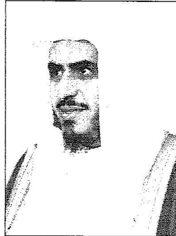
معملي رئيس فرقة العمل للأمر بالمعروف والنهي عن المنكر