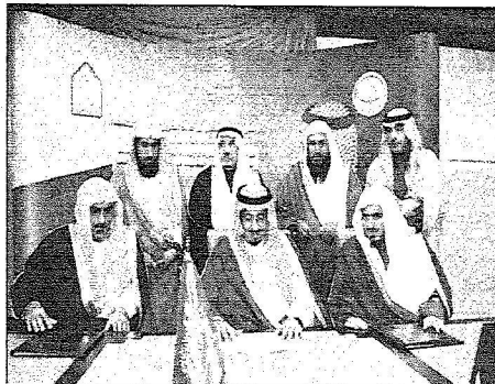
الأمير سلمان في حفل توقيع كرسي سموه