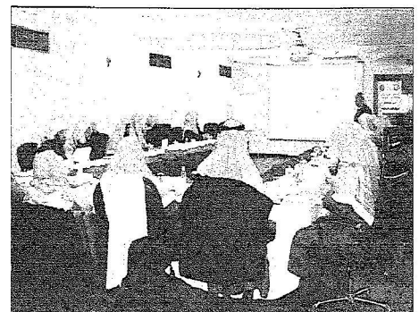
جانب من المتفرجين