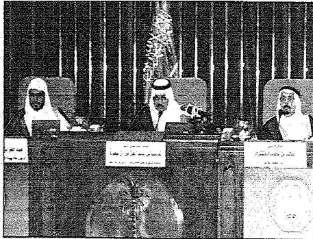
صاحب السمو الملكي الأمير فايض بن عبدالعزيز في حفل تشييد الإستراتيجية