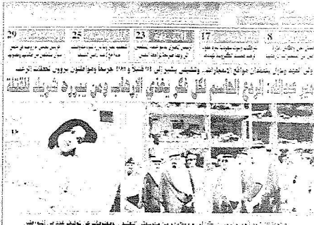
محاكمة 17 شخصا من بين مستشاري أربع منظمات من منظمات العنصرية - وموقوفات عن توليف عدد من المورثين