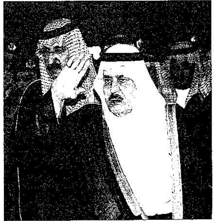
الأمير نايف بن عبدالعزيز قوات الطوارئ

واستهل سمو النائب الثاني الجولة بزيارة لمعسكرات قوات الطوارئ الخاصة القائمة في موقف حجز السيارات الصغيرة على طريق مكة المكرمة الطائف السريع "الكر"، وكان في استقباله صاحب السمو الملكي الأمير محمد بن نايف بن عبدالعزيز مساعد وزير الداخلية للشؤون الأمنية ومدير الأمن العام رئيس اللجنة الأمنية الفريق سعيد بن عبدالله القحطاني ، وفور وصول سموه عرف السلام الملكي ثم صافح سموه قيادات أمن الحج وبعد أن أخذ سموه مكانه في المنصة الرئيسية بديء الحفل الخطابي بعد هذه المناسبة بتلاوة آيات من القرآن الكريم.