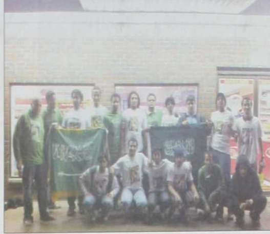
لطة جماعة للمتبعين المشاركين في المسيرة.