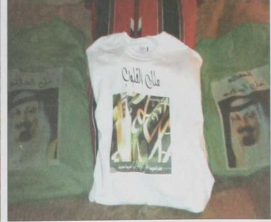
لحصان تحمل صورة ملك الإنسانية وزعت على كل المشاركين في الفعالية

جابت عددا من الولايات وتوقفت عند مستشفى "برسبيتريان" للقاء الوالد