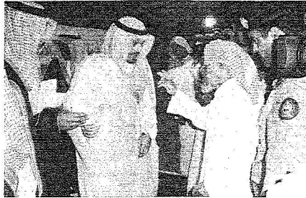
سموه يلتقي بالمواطنين

إلى مشاريع الطرق والسفلة والإتارة، كما تم المحافظ في كلمته جهود الأمير عبد العزيز نحو تطوير المحافظات والراكز والتقاء بالمواطنين واطمئنانة على احوالهم تنفيذاً لتوجيهات خادم الحرمين الشريفين الملك عبد الله بن عبد العزيز وسمو ولي عهده الأمين صاحب السمو الملكي الأمير سلطان بن عبد العزيز حفظهما الله. ثم توجه سمو الأمير عبد العزيز بن ماجد بعد ذلك إلى الرياض على ساحل البحر الأحمر (غرب بدر) وجنوب مدينة ينبع الصناعية حيث استقبل من رئيس المركز ومالي الرابح وشرف الحفل الذي أقاموه وتناول سموه في الكورنيش واستمع إلى مطالب المواطنين مثلما فعل سموه في كامل جولته الحالية وجولاتها السابقة. العزيز بن ماجد إلى محافظة بدر ويحظى باستقبال المحافظ مبارك بن حمود آل نامي والمسعابح وعديري الإدارات والإعسبان والأهالي ويبدأ الحفل الخطابي بالقرآن الكريم ثم يلقي محافظ بدر الأستاذ ميارك آل نامي كلمة رحب فيها بسمو الأمير وضيوفه معتبراً الزيارة امتداداً للنهج الذي تسير عليه القيادة الرشيدة ومتحدثاً عن المشاريع التي حفلت بها بدر في جميع المجالات التعليمية والصحية والتثقيمية والخدمية والصحية والطرق والمياه والكهرباء والاتصالات، وأوضح المحافظ آل نامي جانباً من المشاريع كمنبى محافظة بدر وعدد من مدارس البنين والبنات ومبنى معهد التعليم الفني والتدريب المهني ومبنى الدفاع المدني بالمسيجد ومركز غسيل الكلى ذلك بالإضافة