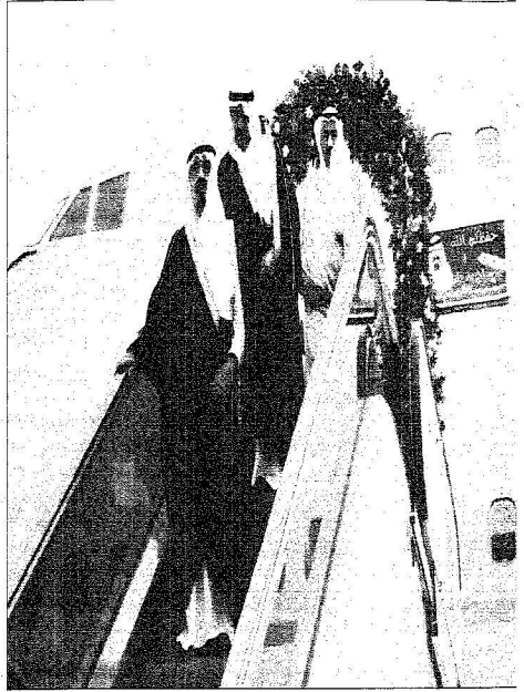
عالم الحرمين الشريفين يزل من سلم الطائرة قفلاً إلى البلاد.