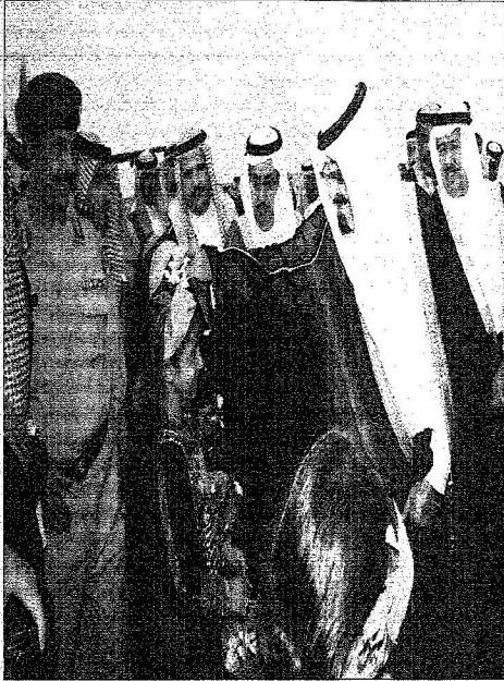
رحب الملك بيا من حفلة استقباله.