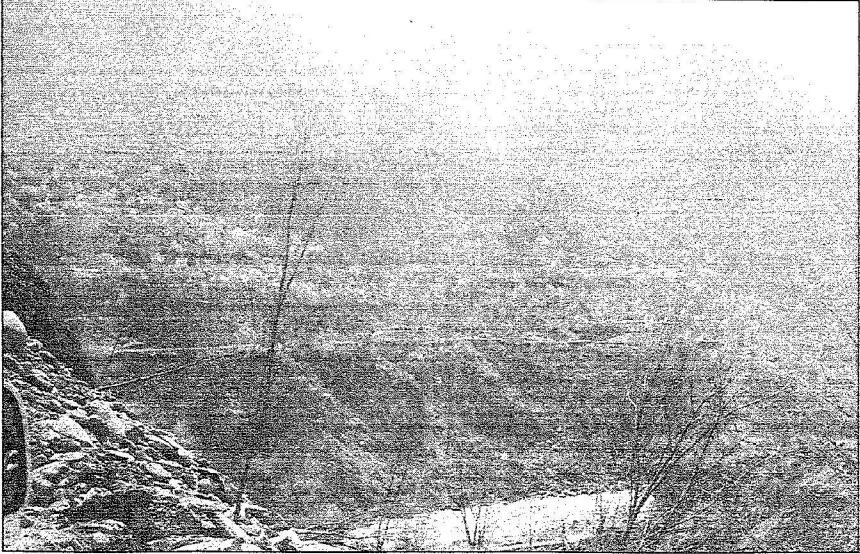
الجموع تضفي جمالها على جبال كشمير

الدمار ليجد منطقتنا عن مظفر أباد، ولتهدم الطرق وانغلاق الممرات الخاصة بالماشية والتي كنا نستخدمها عند سقوط الأمطار، ولقد اصاب الزلزال أي وسيلة للهرب بأضلالنا وأسرتنا الذين سلمهم الله وفيما نحن نرفع أفضنا لدفعن موقانا وتقبل التعازي كانت المساعدات السعودية الياسم الشافي الذي ساهم بعد الله تعالى في انقاذ الكثير من المتضررين ويقانهم على قيد الحياة وخاصة الأطفال وكبار السن من الرجال والنساء، واليوم نشعر بالفخر ونحن نقدم شكرنا لخادم الحرمين الشريفين الملك عبدالله بن عبدالعزيز معربين له عن تقديرنا لمواقفه الإنسانية فلو لا الله تعالى تم سرعة المبادرة السعودية بالوصول إلينا لتعرضنا للكثير من الويلات وأريدكم اخواني في المملكة ان يثقلوا مشاعر كل كشمير الحرة إلى الملك عبدالله بن عبدالعزيز وتعلموه أننا لن ننسى ما حيننا موقف المملكة قيادة وحكومة وشعباً وهذا هو معيار الصديق وقت الضيق وكما تلاحظون اليوم نحن ولله الحمد بخير وننعم بالمساعدات السعودية خياما تسكنها وملابس تكسيها ومواد غذائية نتناولها ٣