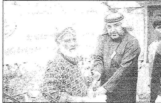
الحملة الشعبية السعودية توزع المساعدات على لاجئي المخيمات