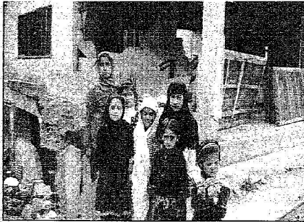
من يبعد لنا إعمار منزلنا؟ هكذا تنكي الصورة