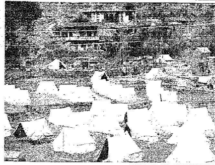
الناخبة في مخيم كوراي إهداء من الأمير الوريث بن متلال