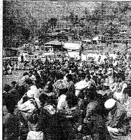
أهالي كوراي كانوا في استقبالنا