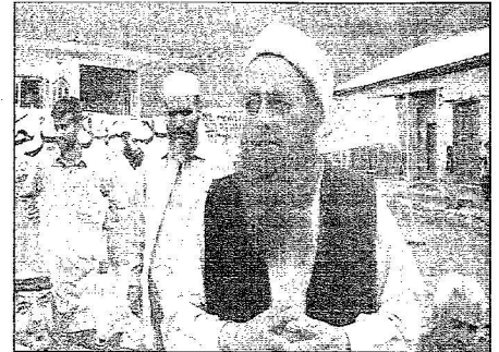
أمير علماء مسلمي كشمير أيشي موانلته في حديثه عن المملكة